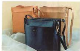
Holiday～お気に入りをつめこんで～

製品部門の一つ目は、イージーカスタマイズの「電熱式燃焼促進装置 clever」で、車の燃費アップ、排ガス抑制など省エネ、環境に配慮した自動車製品。同部門の二つ目は、アトリエエムのまち歩き用皮革製ショルダーバッグ「Holiday」。