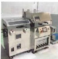
単槽はんだ付け装置